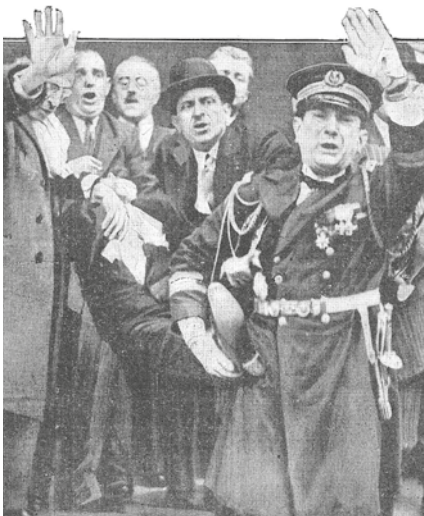
Mordet på Paul Doumer på en bild från "Le Matin" 7 maj 1932, Wikimedia