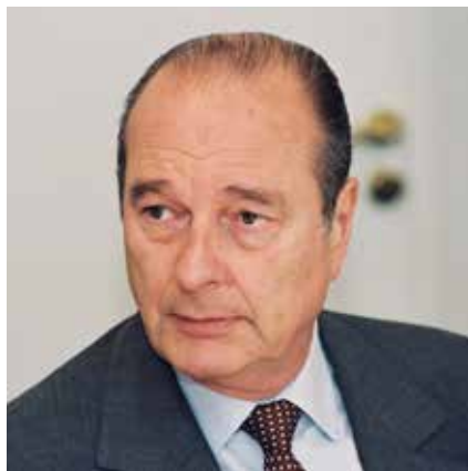
Jacques Chirac kortade presidentämbetets perioder från sju till fem år.

Efter sin politiska gärning var han aktiv i frågor kring miljö och hållbar utveckling. "Notre maison brûle et nous regardons ailleurs" (på svenska: Vårt hus brinner medan vi tittar åt ett annat håll) är ett tal han framförde 2002 på