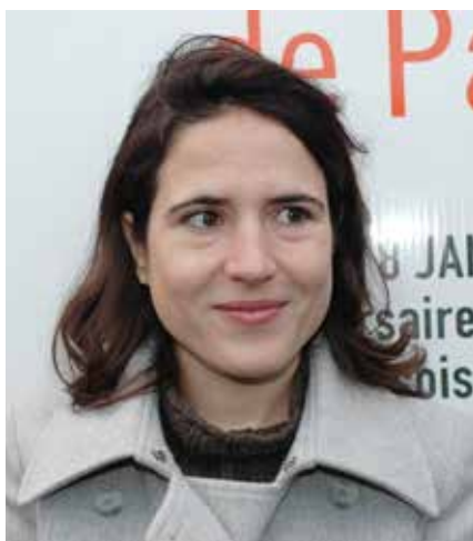
François Mitterrands dotter är professor i filosofi och författare.