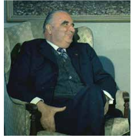
Georges Pompidou har suttit allra längst som premiärminister i den femte republiken.