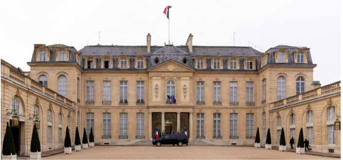
Élyséepalatset är officiellt residens för Frankrikes president. Palatset färdigställdes 1722 och ligger på Rue du Faubourg Saint Honoré nära Champs-Élysée i Paris åttonde arrondissement. Namnet Élysée kommer från de fält i den grekiska mytologin där själarna efter heroiska döda vilar.