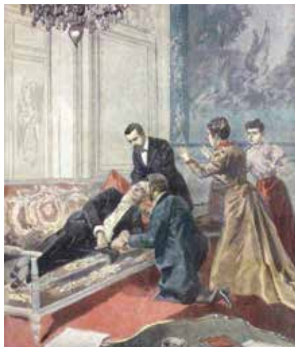
Félix Faure regerade endast fyra år, innan sjukdom ändade hans liv.

Många presidenter har fått gator uppkallade efter sig. En av dem är Félix Faure , som givit namn åt en aveny i bland annat Menton.