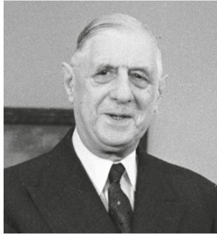
Dagens franska konstitution infördes efter folkomröstning 1958, efter önskemål från Charles de Gaulle.